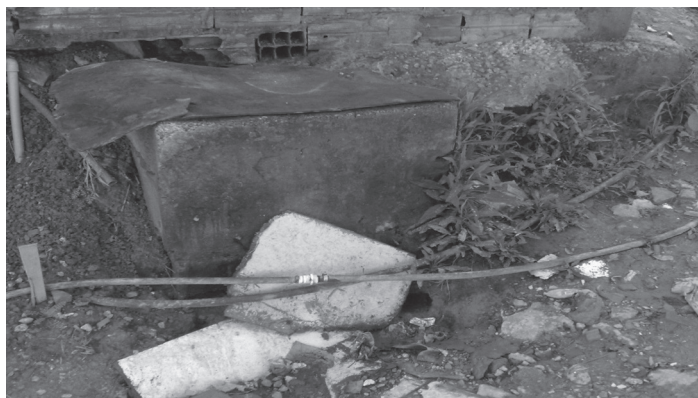
FIGURA 1 Abastecimento de água irregular (“gato”) por mangueira em contato com fossa com vazamento de resíduos

Conforme já ilustrado, a cidade de São Paulo, com seus mais de 11 milhões de habitantes, é expressão viva do processo excludente característico da urbanização brasileira. Com expressiva parcela de pessoas vivendo em assentamentos informais, nos quais o saneamento é bastante precário (Figuras 1 e 2), fica evidente a situação de injustiça ambiental e a necessidade de melhoria das condições de saneamento com vistas à afirmação do direito à cidade.