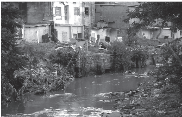
FIGURA 2 Assentamento precário em beira de córrego com condições precárias de saneamento

Se analisarmos a situação do saneamento, especificamente no tocante ao abastecimento de água potável e esgotamento sanitário, pode-se verificar que essas atividades ficaram durante muito tempo sob responsabilidade exclusiva da Sabesp.